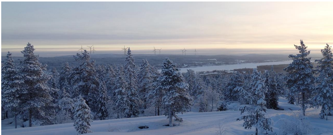
Kuva 2. Panoraamanäkymä Ruotsin puolelta Luppiovaaran näköalaravintolalta kohti Reväsvaaraa. Voimalat näkyvät selvästi jokilaakson ulkopuolisella reunavyöhykkeellä. Etualan puusto vähentää voimaloiden hallitsevuutta maisemakuvassa. Jokilaakson kulttuuriympäristökokonaisuus voidaan hahmottaa omana vyöhykkeenään. Etäisyys lähimpään voimalaan 7,0 kilometriä. Pohjakuvan kinovastaavuus 75 millimetriä.

Ruotsin puolella Övertorneån kunnan joen puoleisella alueella keskeisiä ja kehitettäviä matkailupalveluita on sijoittunut pääasiassa Övertorneån keskustaajamaan, Luppiovaaralle, Risuddeniin. Tuulivoimalat näkyvät näille alueille. Myös merkittävimmät vaikutukset valtakunnallisesti arvokkaihin maisema-alueisiin syntyvät näkyisiin Ruotsin puolelta kohti Reväsvaaraa. Ottaen huomioon Ruotsin puoleisen jokilaakson arvokkaan kulttuuriympäristöalueen (riksintresse) laajuuden, luonteen ja suuntautuneisuuden, ei vaikutusten voida kokonaisuuden kannalta katsoa olevan merkittävästi haitallisia kohteen arvojen ja luonteen säilymisen kannalta. Riksintresse –alueeseen sisältyvien yksittäisten vastarannalla sijaitsevien kohteiden kannalta vaikutus näkyisiin voi paikoitellen olla merkittäväkin.